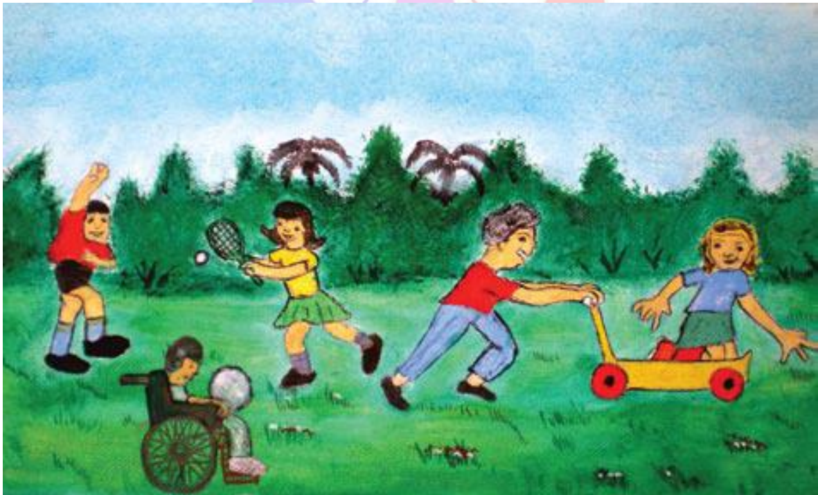
1. بیسمارک بناویدس، ۱۳، نیکاراگونه

ارجاع: یونیسف و موسسه‌ی ویکتور پیندا (دنیایی توانمند). ۲۰۰۸. موضوع توانایی است! : توضیحی درباره‌ی کنوانسیون حقوق افراد توان‌خواه (دارای معلولیت). ترجمه‌ی بهناز توکلی. سایت حق کودکی، ۲۰۱۵