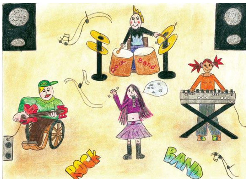
3. الریا دی اولاً، ۱۶، ایتالیا